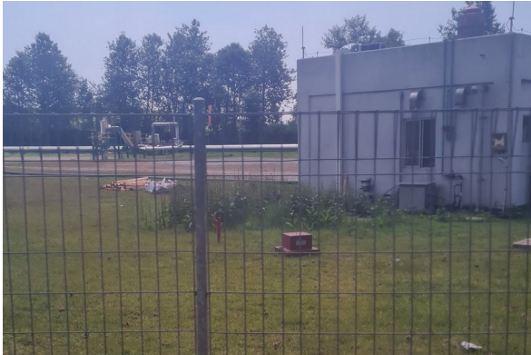
Gedung kantor / basecamp PLTP Patuha.