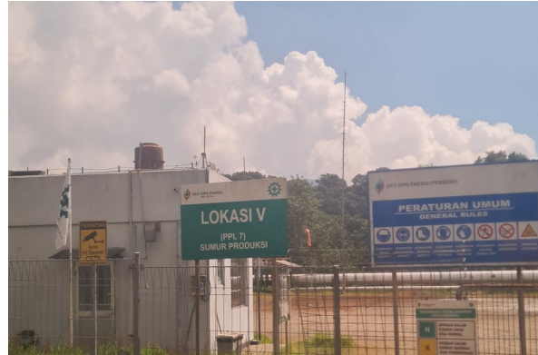
Bangunan kantor pendukung.